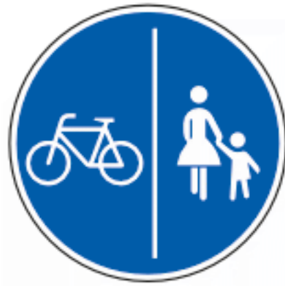
Getrennter Rad- und Gehweg