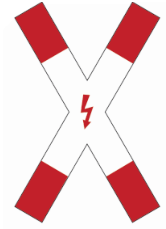
Andreaskreuz ( Oberleitungen )