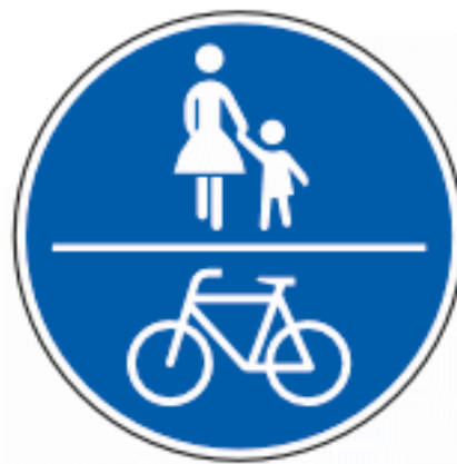
Gemeinsamer Geh- und Radweg