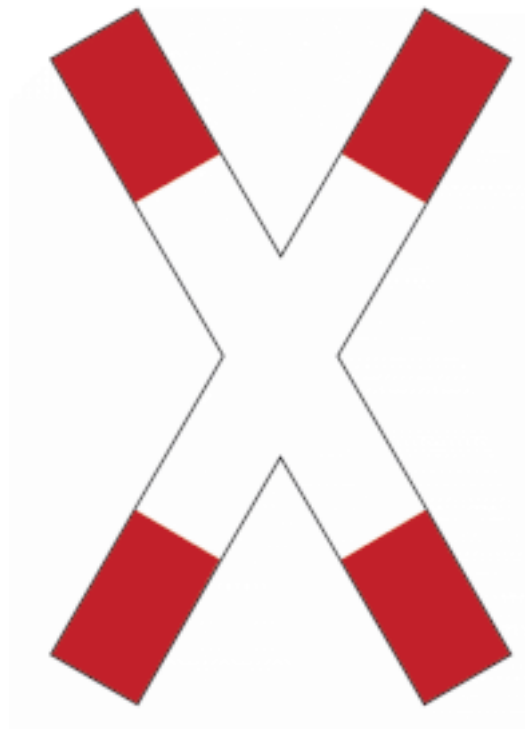
Andreaskreuz ( ohne Oberleitungen )